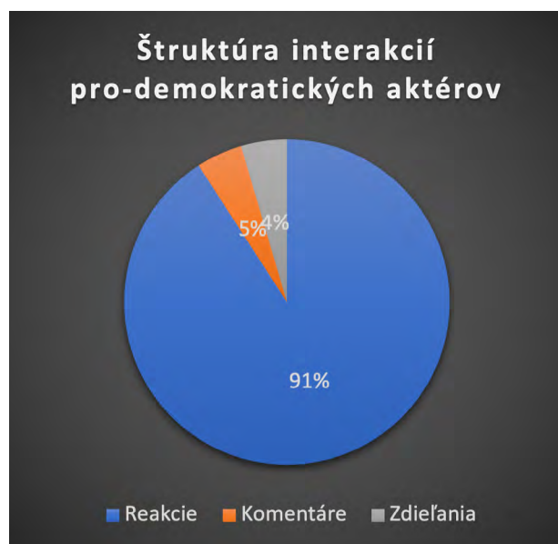
Grafy boli vyhotovené súčtom jednotlivých typov interakcií top 3 príspevkov v skupine Problematické zdroje a v skupine Pro-demokratickí aktéri.